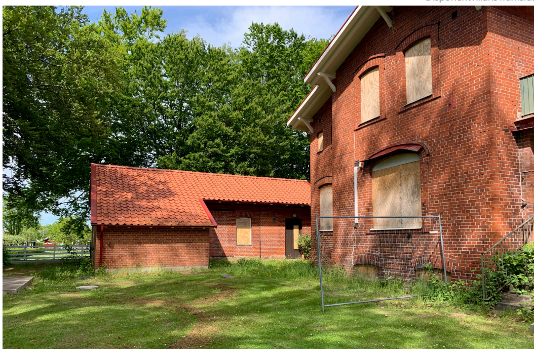
Disponentvillans baksida med den nya entrén och annexet