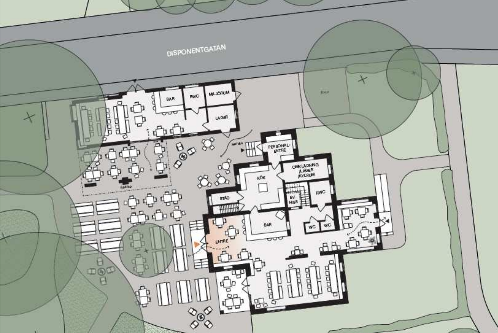
Planritning, Kanozi arkitekter