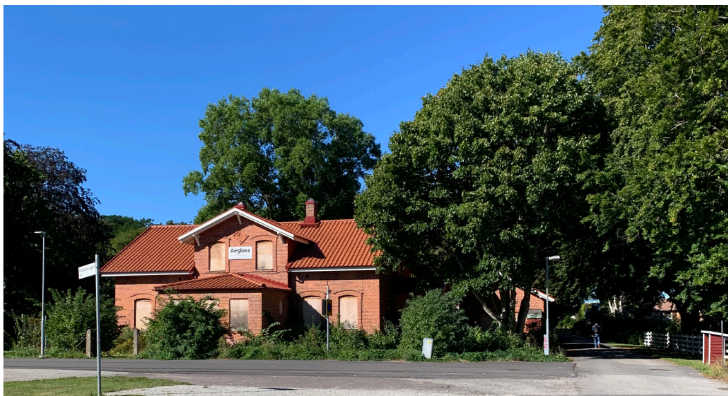
Vy från öst