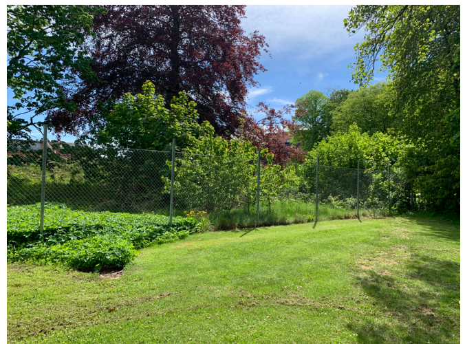
Blodbok, magnolia och svarttall i Disponentvillans trädgård som en del av Sockerbruksparken

Ovanvåningen görs tillgänglig med en ny slank trappa. Tillbyggnadsförslaget av annexbyggnaden ger en större flexibilitet i hur denna del kan användas över året, då det tillåter för fler sittningar inomhus. Sittytan utomhus under tak skapar en finstämd övergång mellan inne- och utemiljö, och med sin eldstad erbjuder detta rum fina kvaliteter till hela gårdens uteservering. Tillbyggnadsdelen med skärmtaket har en enkel men formstark volym som kläs med corténplåt och torrängstak. Lokal inspiration hämtas från tillbyggnader på Järnvägskrogen och vid Staffanstorp Gästis.